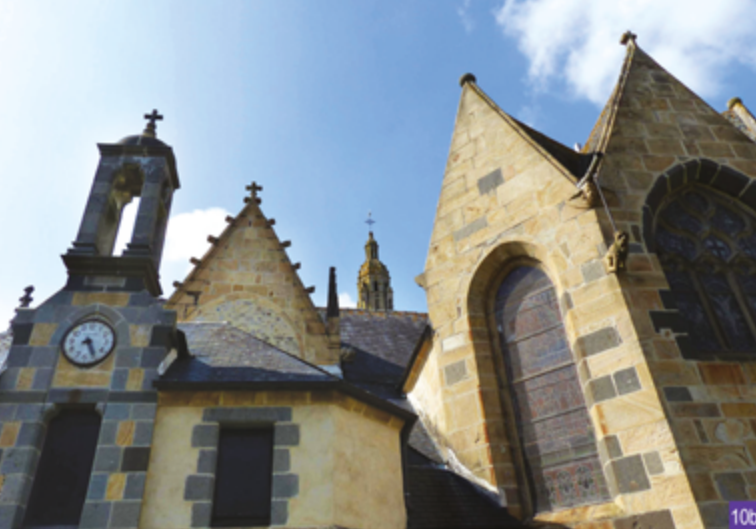
10b. Les pierres grises en kersanton se démarquent de la pierre de Logonna, dorée

L'église Saint-Sauveur présente la particularité d'être située sur une rive de la Ster Goz - vieille rivière en breton - une zone instable par nature et isolée. Sur l'église sont visibles les deux pierres caractéristiques des constructions du Faou : le kersanton, gris et la pierre de Logonna, dorée (10b).