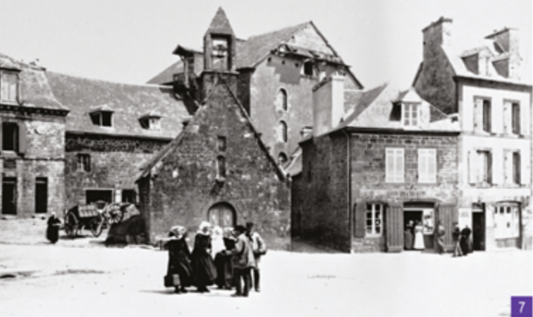
7. La chapelle Saint-Joseph vers 1910