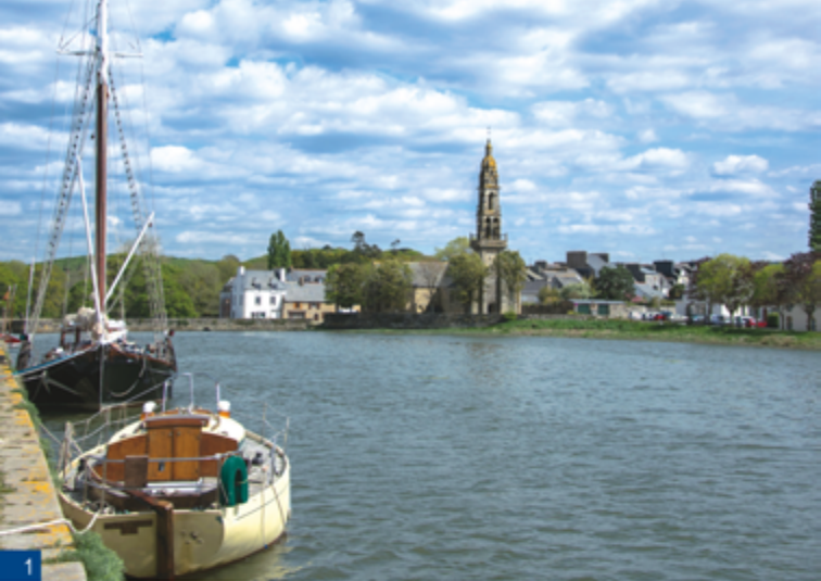
1. Le port du Faou, dans le fond de la rade de Brest