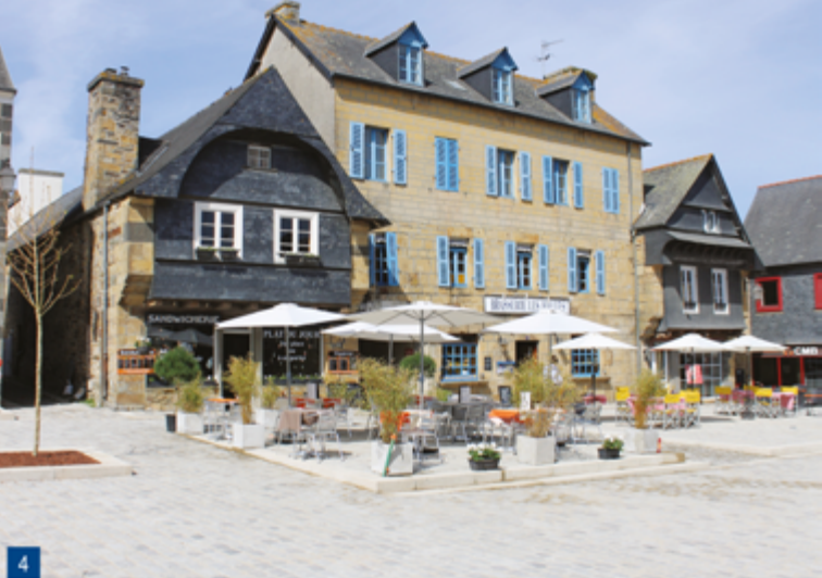
4. Une maison de notable