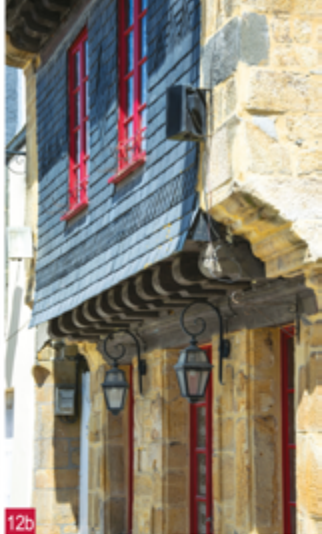
12a. La Frégate, ancienne maison de marchand / 12b. Détail de l'encorbellement du mur latéral