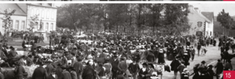
14. Les halles du Faou / 15. La place aux Foires au début du XX e siècle

pour inséminer les juments et assurer le maintien et l'amélioration des races chevalines. Dans la cour d'une propriété au nom évocateur « Les haras », subsistent des boxes, dernière trace de cette activité ayant perduré jusqu'en 1968.