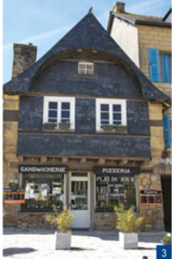
2. Ancien relais de poste / 3. Cette maison fut une prison avant 1680